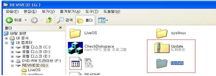
(그림 6) Firmware Update 파일의 압축해제

2단계) 윈도우상에서 Usb의 다운받은 파일을 더블클릭하여 압축을 풀어줍니다.