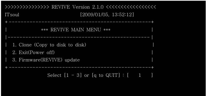
(그림 1) 메뉴출력