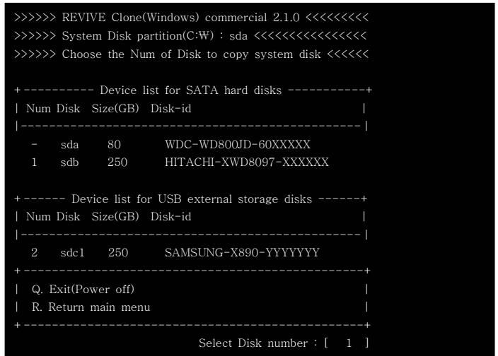
(그림 2) 메뉴선택

(1. REVIVE Main Menu) 에서 1번을 누르면 아래 화면이 나타나고 여기에서 시스템을 복제할 대상 하드디스크번호를 선택한 후 엔터를 치면 아래 (그림3)에서처럼 클로닝이 수행됩니다.